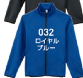
032 ロイヤル ブルー