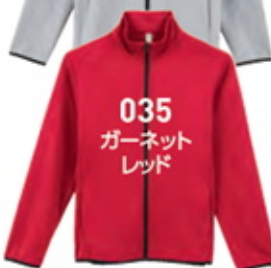
035 ガーネット レッド