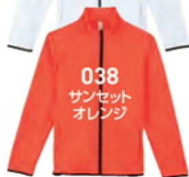
038 サンセット オレンジ